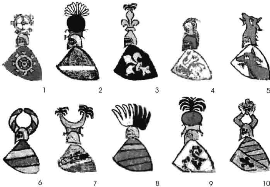
Сл. 2. Избор грбова приказаних у Циришком грбовнику насталом око 1340. године

чета, розете и перјанице (Сл. 2.2). 14 Идентични амблеми приказани су и на другим грбовима Циришког грбовника. Основно питање које ове и друге аналогije са представама на динарима краља Душана, али и на другим споменицима српског средњег века, постављају односи се на путеве утицаја и прожимања.