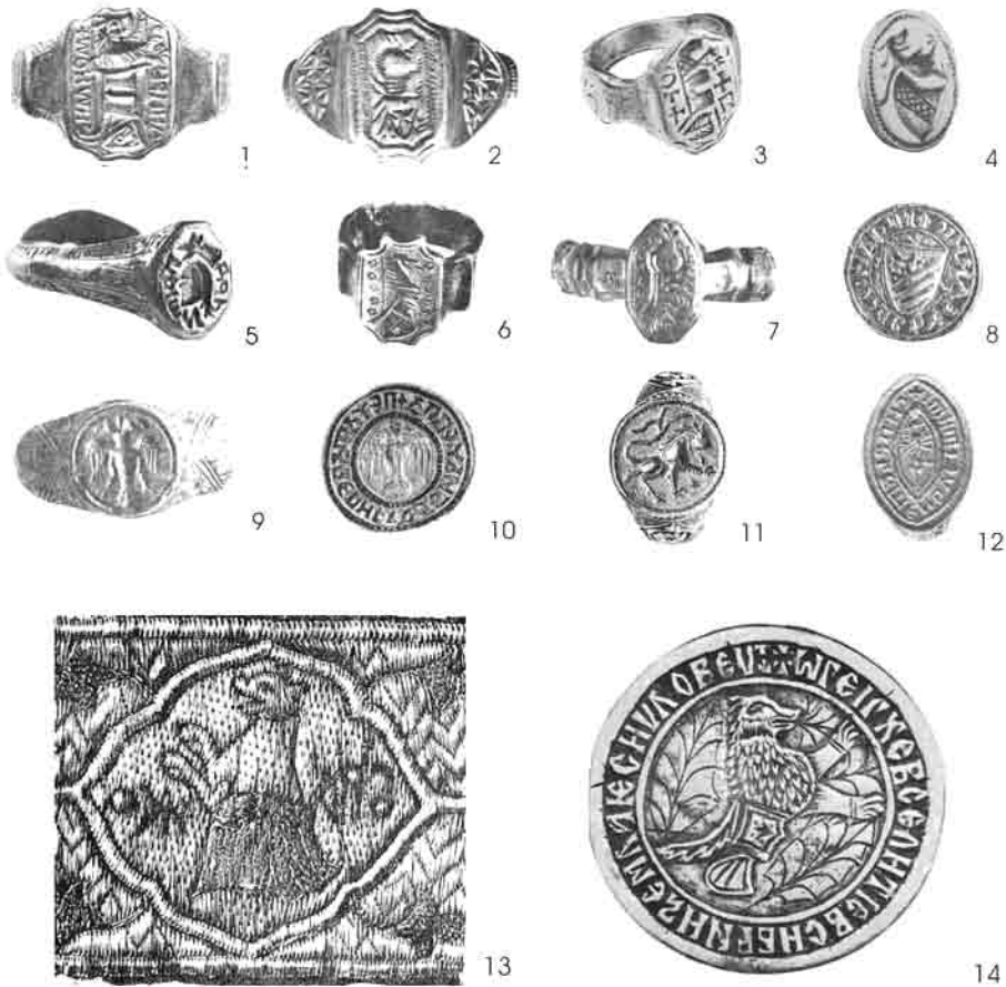
Сл. 4. Представе хералдичких обележја — грбова и амблема на прстењу (1–12), појасу севастократора (?) Бранка (13) и медаљону (14)

Београду представљени су само шлем и глава вука са разјапљеним чељустима, без штита (Сл. 4.5). 69