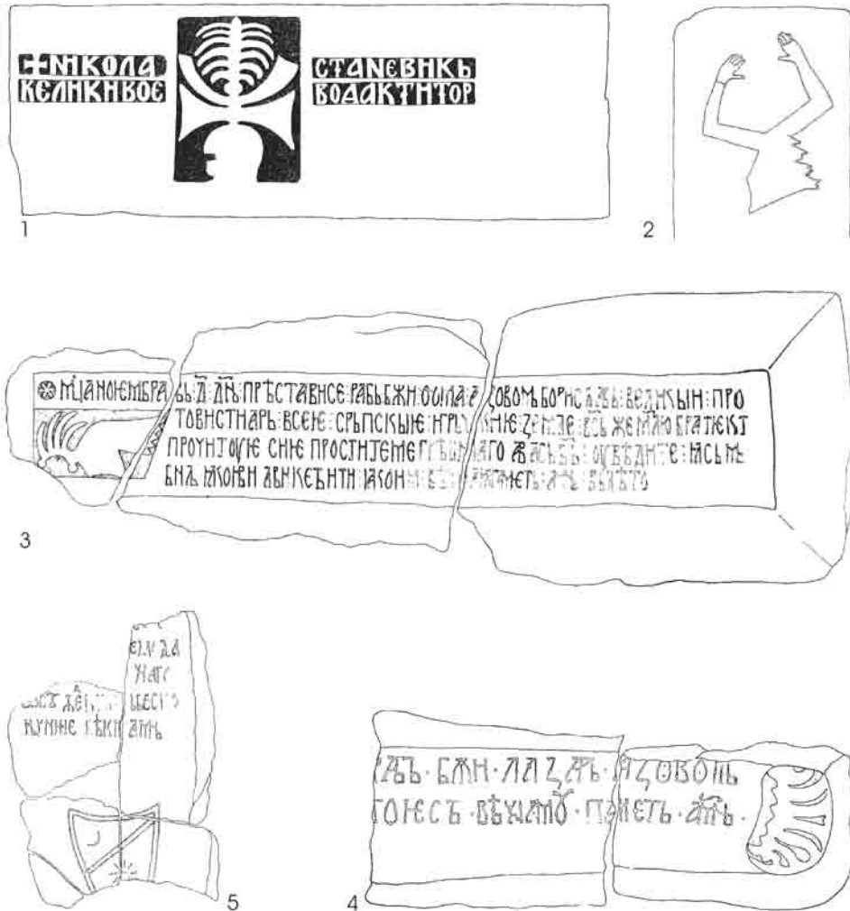
Сл. 3. Надробне плоче са хералдичким обележјима