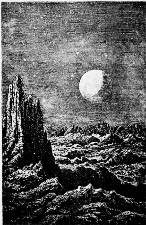
Земля гледана са Месеца