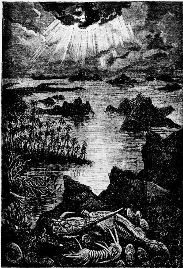
Прва козна и први обитници наше Земље.