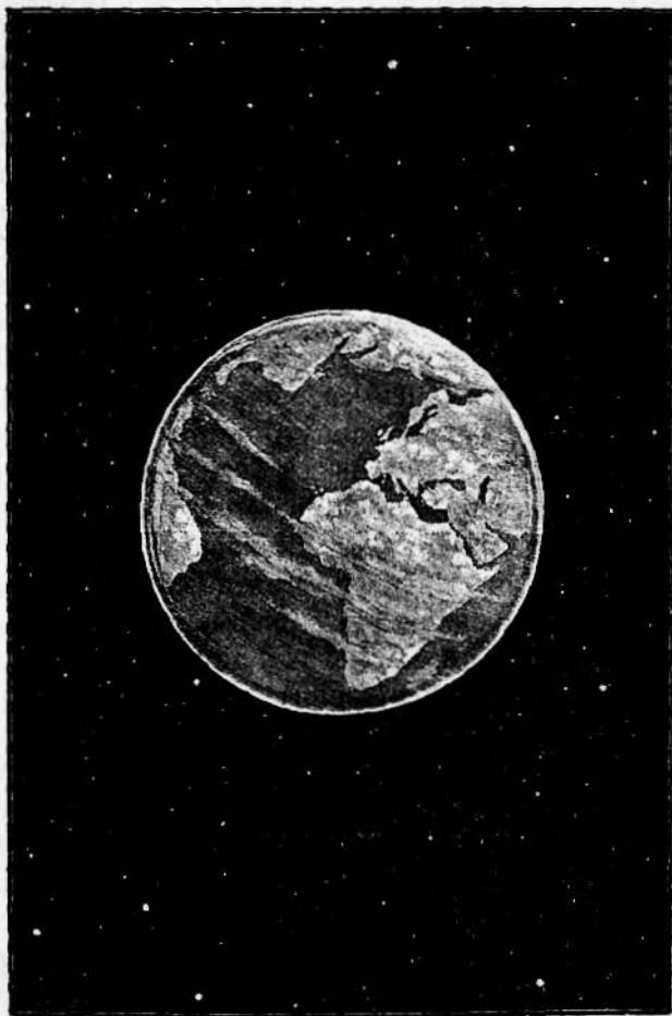
Наша земља међу звездама