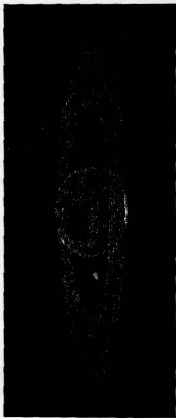
Сунчани комплекс од 26 милиуна и 400 хиљада сунца.

тала око своје осе и она би добила овакав исти облик; ваша Земља кад се од свог оца Сунца одвајала, имала је исти облик; од њеног обруча образовао се њен пратилац, ваш Месец; ваш Јупитер, у пранскони својој, имао је овакав исти облик: а од његова четири обруча образовала су се четири његова пратиоца; ваш Сатурно има и дан-данас овакав облик... Па и ваше Сунце са целом својом многобројном породицом има овакав исти облик.... Тако је то: кад разбијамо какав већи кристал у каква милијерала, он пресе у стотину комада; али сви ти комади имају исти облик онога већег кристала. Тај исти закон влада и у постајању светова — сунца и сунчаних планета... Је ли тако?“... окрете се он вођу моме.