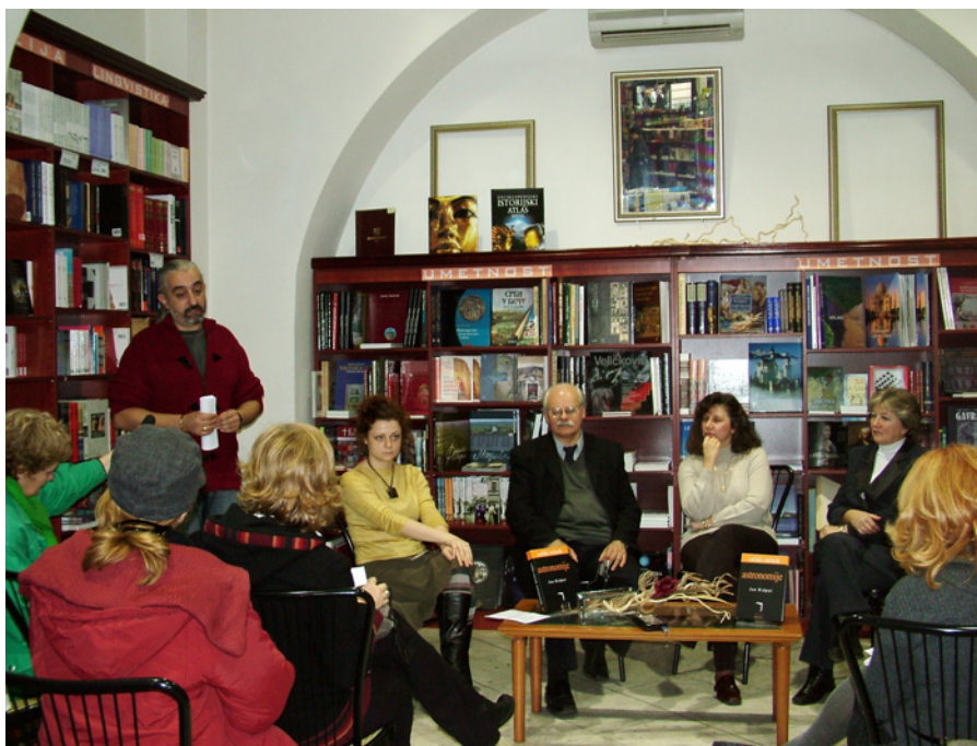
Слика 17: На промоцији "Речника".