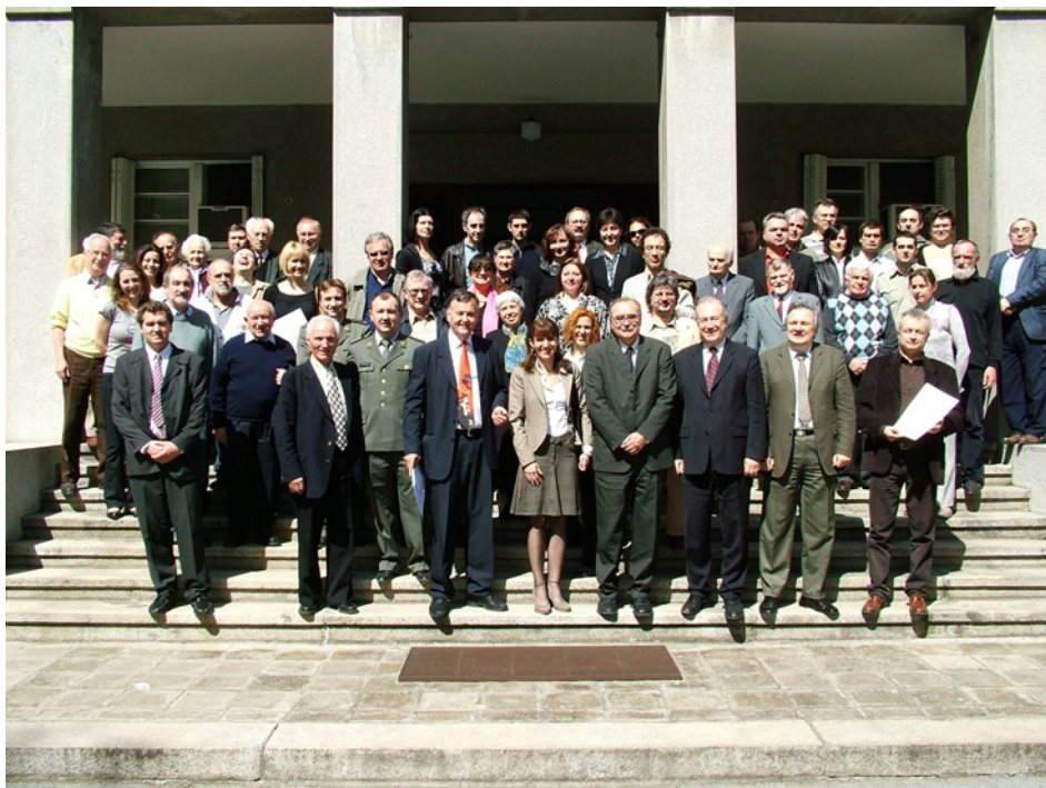
Слика 22: Прослава 121. годишњице Астрономске опсерваторије.