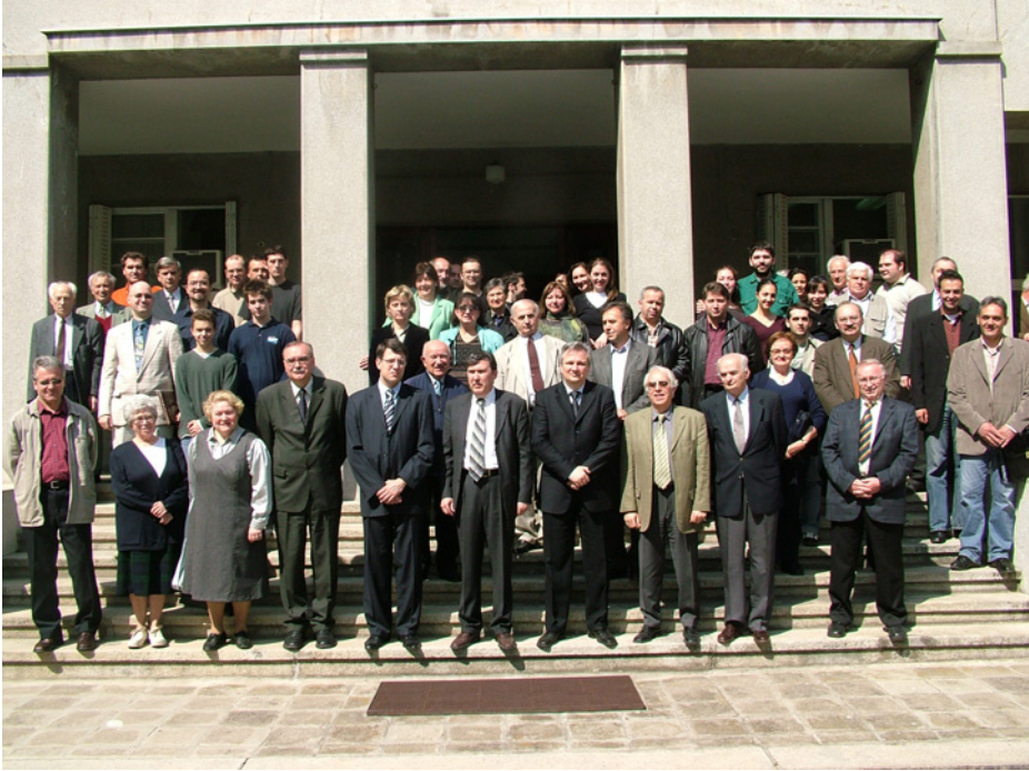
Слика 6: Прослава 120. годишњице Астрономске опсерваторије.